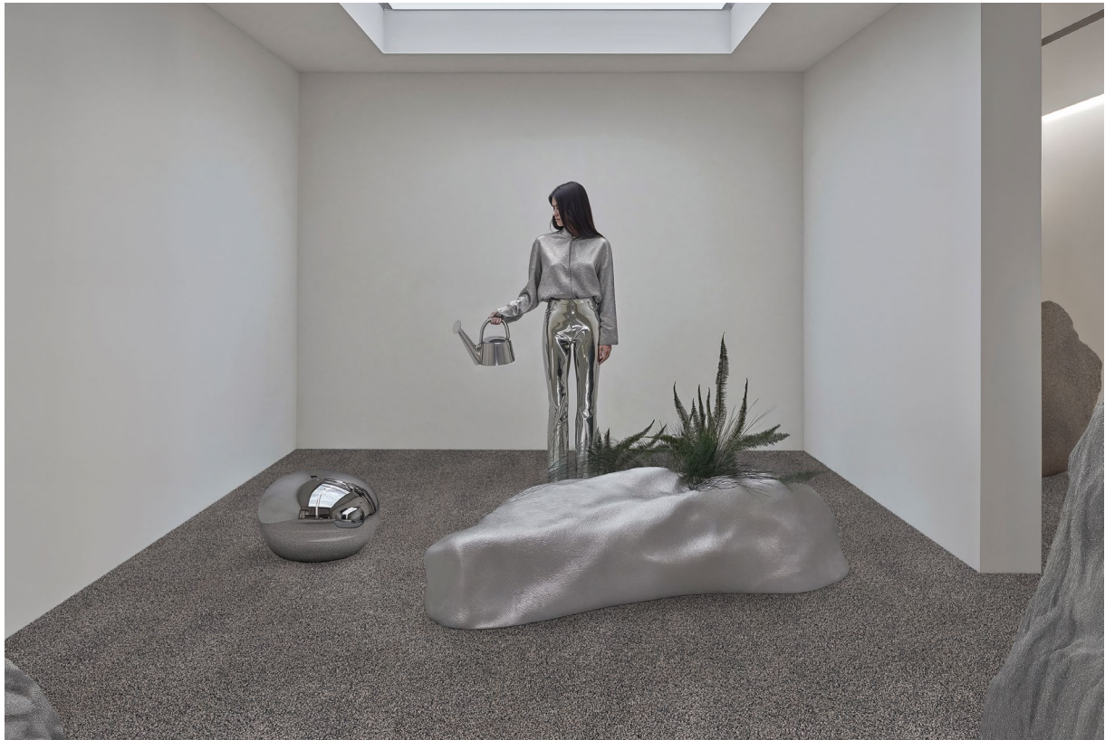
HELIX DUOO | OBJECT CARPET